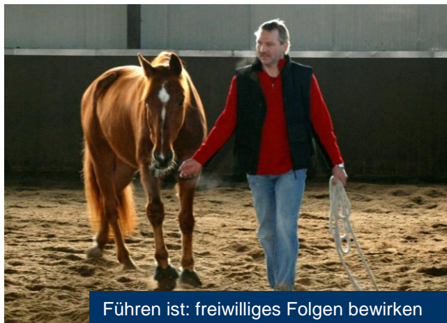
Führen ist: freiwilliges Folgen bewirken

Der Gewinn für das Unternehmen ist eine motivierte, tolerante, zielstrebige, bewusste, teamfähige Führungsmannschaft.