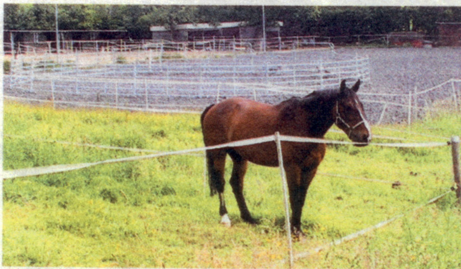
Der Reiterhof „Am Sonnenhang“ in Eichen bietet mit seinen Paradiesställen ein außergewöhnliches Umfeld für Pferd und Reiter.

Informationen zu den Seminaren aber auch zu noch vorhandenen Einstellplätzen: Tel. 0160 / 18 073 21; www.Reiterhof-am-Sonnenhang.de . -sh-